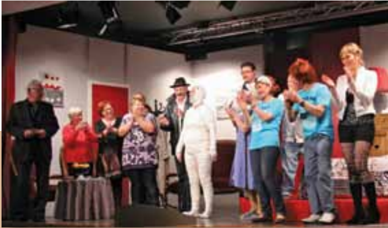
« Lach net, du armer Deifel ! », pièce de théâtre de l'ATAK