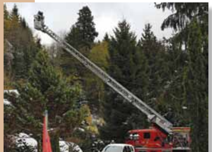
Un exercice des sapeurs pompiers de Kruth, Oderen et Saint-Amarin