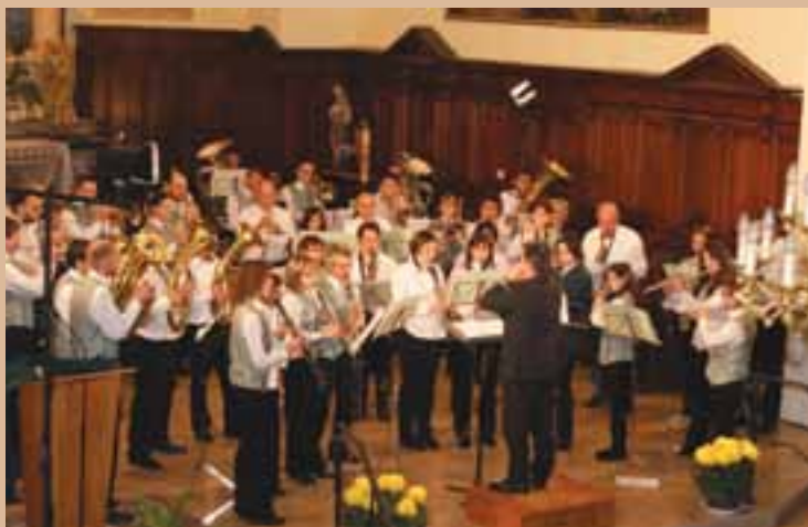
Le concert de la Musique Municipale de Kruth