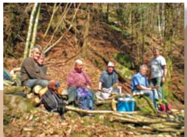
Les bénévoles sur le sentier des douaniers