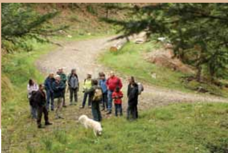
Une sortie du conseil municipal