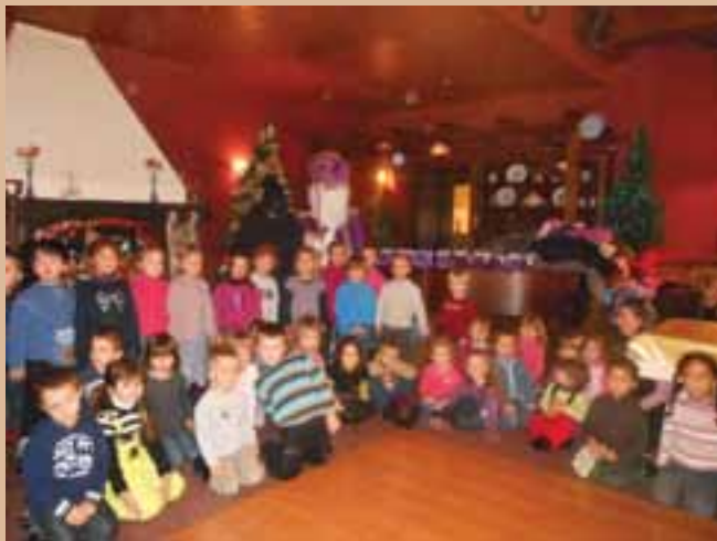
Les enfants de l'école maternelle à l'Auberge de France