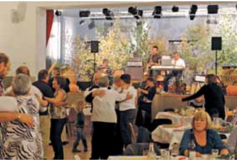
La fête d'automne