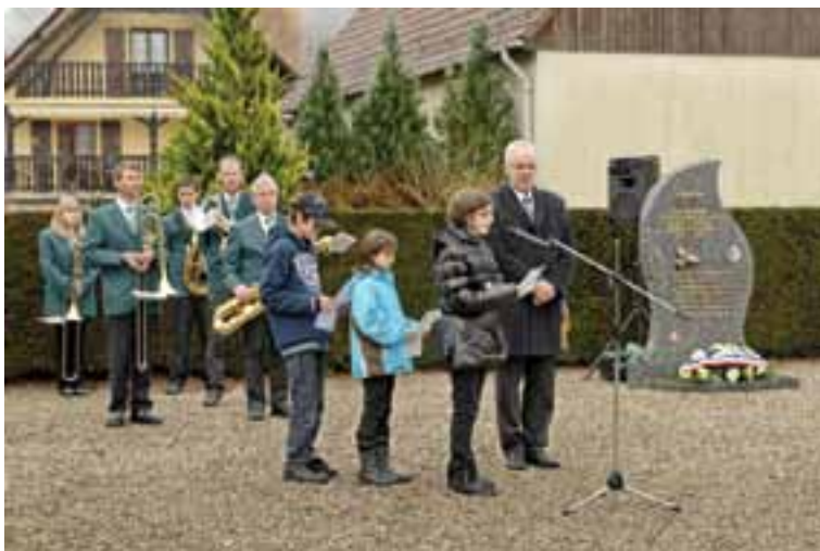
La cérémonie du 11 novembre