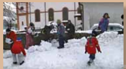
La construction d'un mur de neige dans la cour de l'école