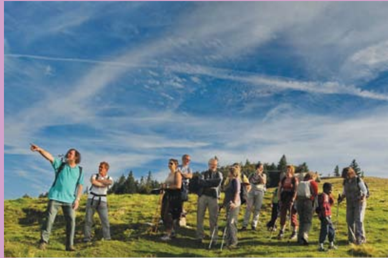
Sortie du Conseil Municipal au Huss