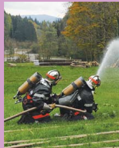
Exercice d'automne Sapeurs Pompier