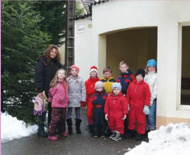
Enfants de Wildenstein attendant le bus