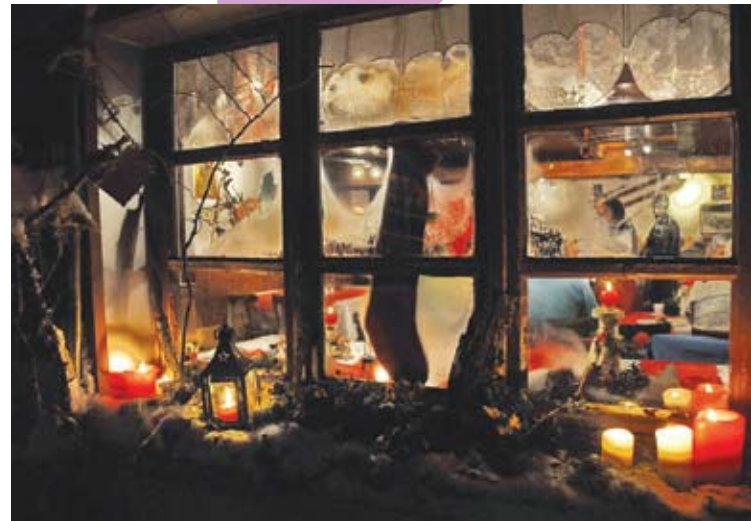
Ski Club Kruth, talents montagnards