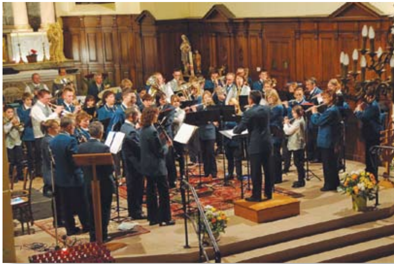
Concert de la Musique Municipale de Kruth et des Loisirs Vétérats