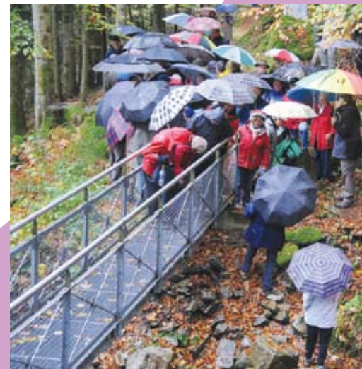
Inauguration de la passerelle sentier Michel